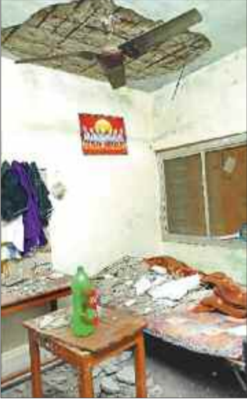
छत का गिरा प्लास्टर।