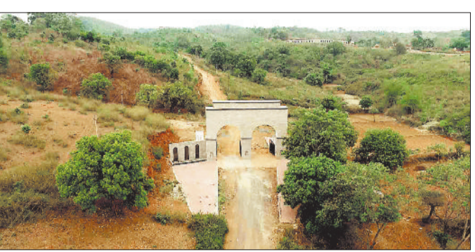
घाट-पहाड़ के बीच विवि परिसर का मुख्य द्वार।

संत गहिरा गुरु विवि को ग्राम पंचायत भकुरा में आवंटित भूमि हाथियों का पारंपरिक रहवास क्षेत्र है। अपने आवागमन के दौरान हाथियों का दल यहां एक-एक सप्ताह तक रुकता है। प्रशासनिक भवन को नए परिसर में शिफ्ट करने की तैयारियों के बीच