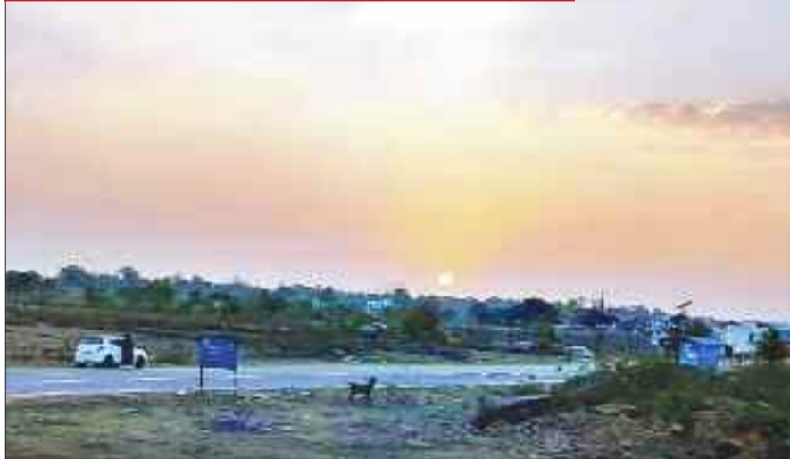
बैकुंठपुर। बीचों बीच दिनों से लगातार मौसम साफ बना हुआ है। इस दौरान गोधूली की बेला में हल्के बादलों के बीच ढलते सूर्य का मनमोहक नजारा देखने को मिलता है, इसे देखकर मन में अलग ही तरह का रोमांच भर जाता है।