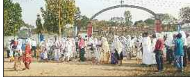
प्रार्थना के लिए गिरजाघर पहुंचे समाज के लोग।

खड़गवां। ईसाई समुदाय द्वारा प्रभु यीशु मसीह के बलिदान होने का पर्व सरभोका में शुक्रवार को गुड फ्राइडे मनाया गया।