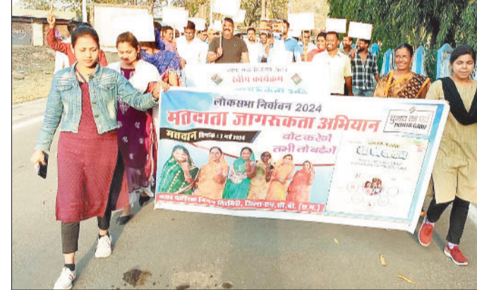
निकली मतदाता जागरूकता रैली।

स्वीप कार्यक्रम के तहत 233 ग्राम पंचायतों एवं सभी नगरीय निकायों में मतदाता जागरूकता के लिए शपथ कार्यक्रम एवं जागरूकता रैली निकाली जा रही है। नगर पंचायत, नगर निगम एवं ग्राम पंचायत में मतदान करने के लिए शासकीय अमलों के साथ-साथ जनभागीदारी भी देखने को मिल रहा है। वोट करोगे तभी तो बढ़ेंगे के उद्देश्य के साथ प्रचार-प्रसार किया जा रहा है। लोकसभा निर्वाचन में कलेक्टर एवं जिला निर्वाचन अधिकारी के द्वारा जिले वासियों से अपने मत का उपयोग करने की अपील की जा रही है। 7 मई को शत-प्रतिशत मतदान के लिए समस्त 388 पोलिंग बुथ में प्रशासन के द्वारा मूलभूत सुविधाओं को सुनिश्चित किया जा रहा है, जिससे मतदाताओं को